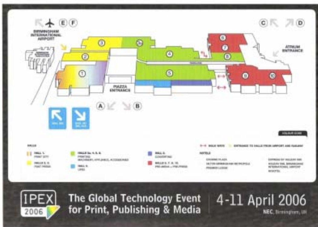
図2 IPEX2006の会場図、当初は10号館が20号館として発表されていた。多分、6号館の北側に会場を確保していたが出展数が伸びなかったのであろう。2006年3月20日にIPEX本部から送られてきたPre Show Planner(Printing Worldの編集)では9, 10号館が9号館となり、6号館の北側に20号館がまとめられていた。